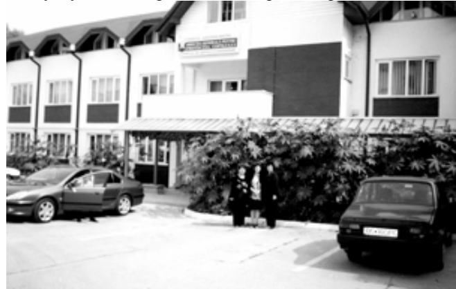
Здание администрации Реабилитационных Центров в городе Бакэу

Реабилитация проводится согласно индивидуальному плану с учетом потребностей и проблем ребенка.